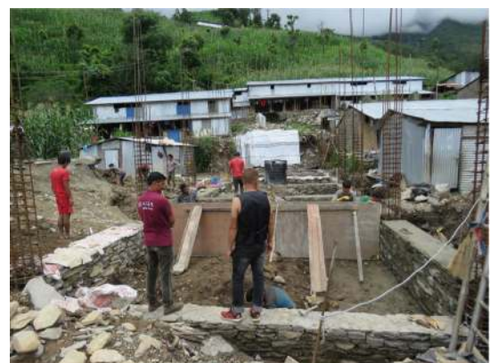
Reconstruction of Arukharkha school

Unter https://www.youtube.com/watch?v=6ayc-rb10tY können Sie ein Video über die Grundsteinlegung einer der Schulen ansehen.