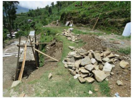
The first phase of the reconstruction of Namuna school