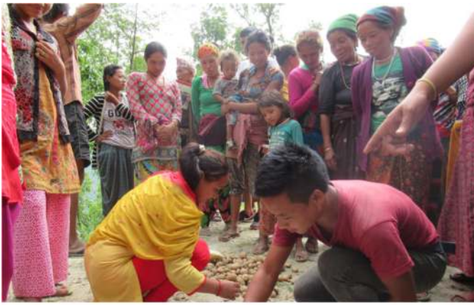
The trainers evaluate the potatoes cultivated with organic techniques